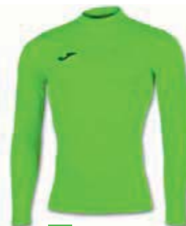
101018.020 GREEN FLUOR