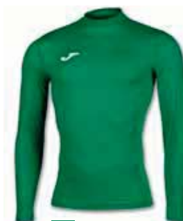
101018.450 GREEN MEDIUM