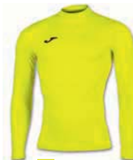
101018.060 YELLOW FLUOR