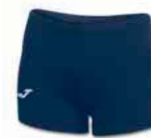
900477.331 DARK NAVY

N.O.S. Serigrafiado / Printed / Stampato