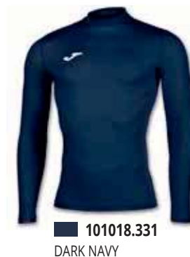
101018.331 DARK NAVY