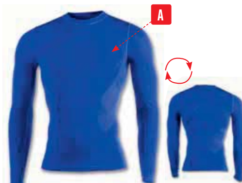
100764.701 DARK ROYAL