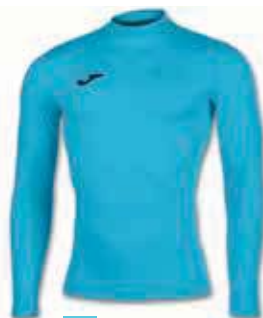
101018.010 TURQUOISE FLUOR