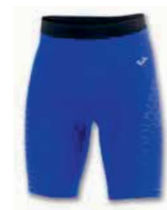
101111.701 DARK ROYAL