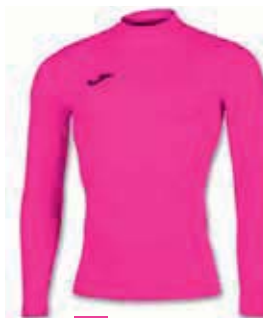
101018.030 PINK FLUOR