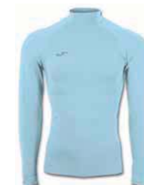
101650.350 SKY BLUE