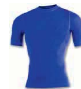
100765.701 DARK ROYAL