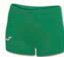
900477.450 GREEN MEDIUM