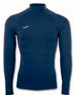
101650.331 DARK NAVY