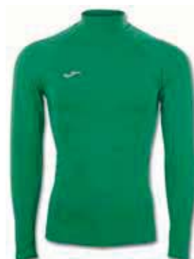
101650.450 GREEN MEDIUM