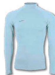
350 SKY BLUE