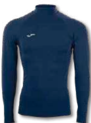
331 DARK NAVY