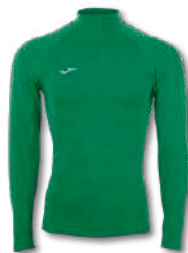
450 GREEN MEDIUM