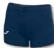
331 DARK NAVY