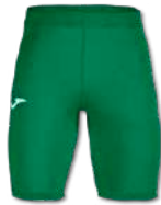
450 GREEN MEDIUM