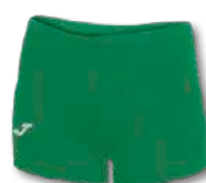
450 GREEN MEDIUM