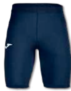
331 DARK NAVY