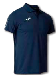
331 DARK NAVY