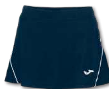
331 DARK NAVY