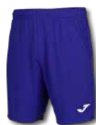
728 SURF THE WEB