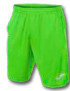
020 GREEN FLUOR