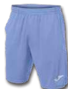
715 VISTA BLUE