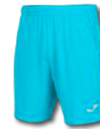
010 TURQUOISE FLUOR