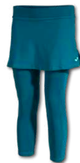
727 OCEAN DEPTHS