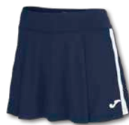
332 DARK NAVY/WHITE