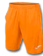
050 ORANGE FLUOR