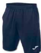
331 DARK NAVY