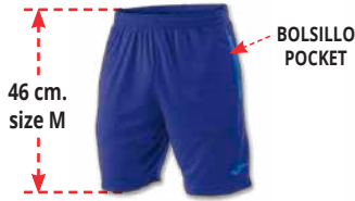
700 DARK ROYAL

Shorts with pockets and adjustable elastic drawstring for optimal fit.