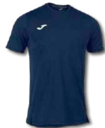
331 DARK NAVY