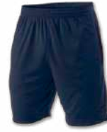
331 DARK NAVY