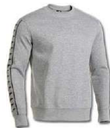
251 LIGHT MELANGE