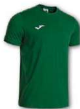
450 GREEN MEDIUM