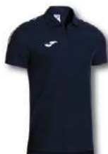
331 DARK NAVY