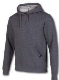
280 MEDIUM MELANGE