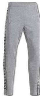
471 JUNE BUG