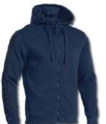
330 DARK NAVY