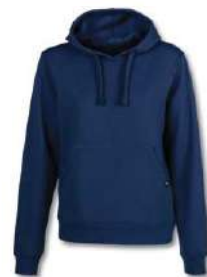
331 DARK NAVY