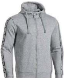
251 LIGHT MELANGE