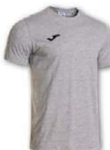
251 LIGHT MELANGE