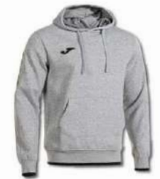
251 LIGHT MELANGE