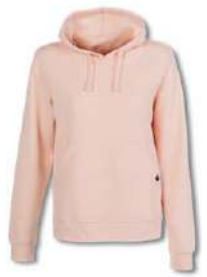
540 COULS PINK