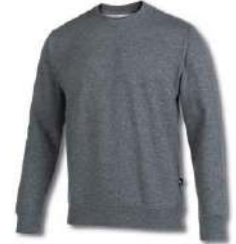
280 LIGHT MELANGE