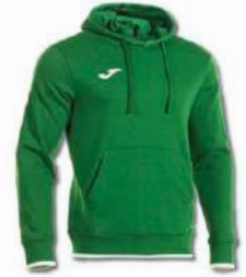
450 GREEN MEDIUM