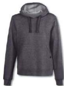
280 MEDIUM MELANGE