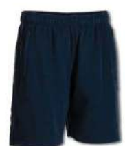
330 DARK NAVY