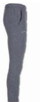
280 MEDIUM MELANGE