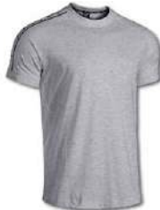
251 LIGHT MELANGE