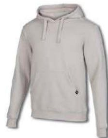
001 DARK WHITE