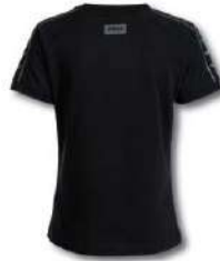
330 DARK NAVY