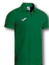
450 GREEN MEDIUM