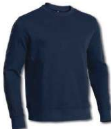
330 DARK NAVY