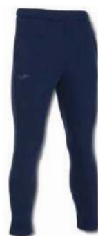
331 DARK NAVY