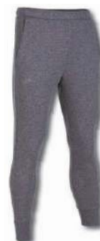
280 LIGHT MELANGE