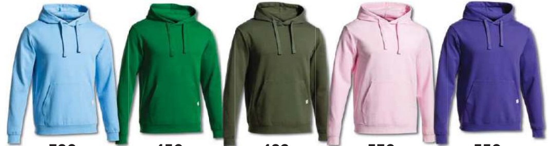
380 SKY MEDIUM