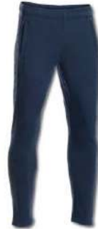
251 LIGHT MELANGE