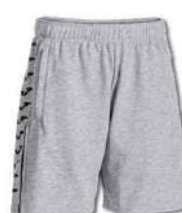
251 LIGHT MELANGE