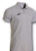
251 LIGHT MELANGE