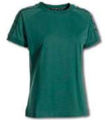
471 JUNE BUG