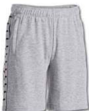
251 LIGHT MELANGE