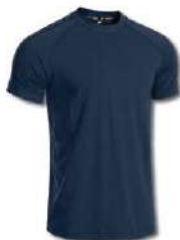
330 DARK NAVY