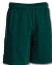
471 JUNE BUG