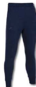
331 DARK NAVY