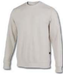
001 DARK WHITE

Sweatshirt with collar, cuffs and hem made of rib providing maximum comfort. Included logo on label.