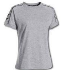
251 LIGHT MELANGE