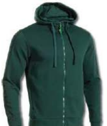
471 JUNE BUG