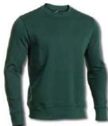
471 JUNE BUG