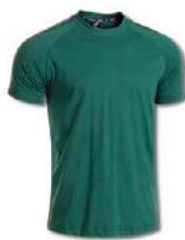
471 JUNE BUG