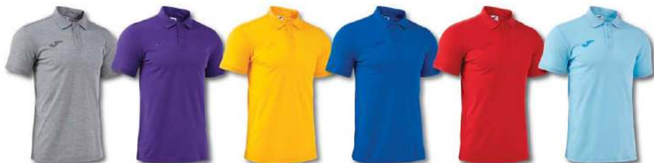
250 LIGHT MELANGE