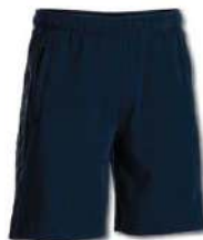
330 DARK NAVY