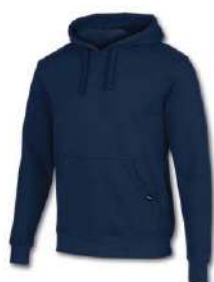
331 DARK NAVY