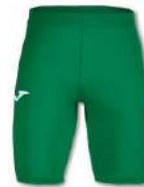
450 GREEN MEDIUM