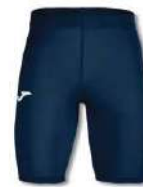
331 DARK NAVY