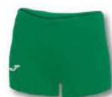
450 GREEN MEDIUM