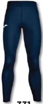
331 DARK NAVY