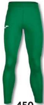
450 GREEN MEDIUM