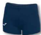
331 DARK NAVY