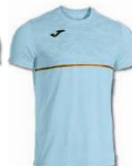
350 SKY BLUE