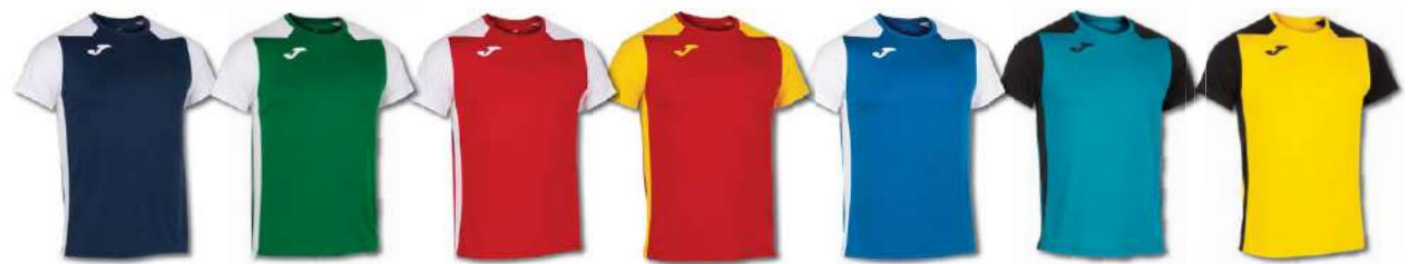
332 DARK NAVY/ WHITE 452 GREEN MEDIUM/ WHITE 602 RED/ WHITE 609 RED/ YELLOW 702 ROYAL/ WHITE 725 BLUEBIRD/ BLACK 901 YELLOW/ BLACK