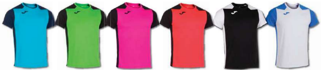
013 TURQIOSE FLUOR/ DARK NAVY 021 GREEN FLUOR/ BLACK 031 PINK FLUOR/ BLACK 041 CORAL FLUOR/ BLACK 102 BLACK/ WHITE 207 WHITE/ ROYAL

Camiseta de tejido ligero. Cuello y mangas con corte al láser que evita rozaduras y aporta el máximo confort. Diseño y logotipo sublimados. T-shirt made of lightweight fabric and laser cut at the neck and underarm to prevent chafing. Sublimated design and logo.