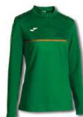
450 GREEN MEDIUM