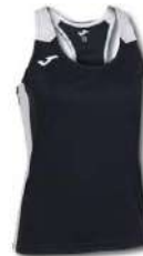
102 BLACK/ WHITE