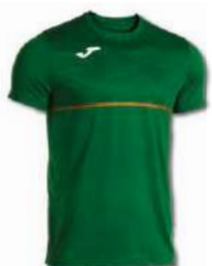
450 GREEN MEDIUM