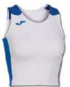
207 WHITE/ ROYAL