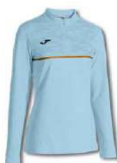
350 SKY BLUE