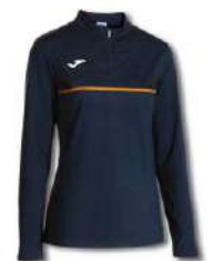
300 DARK NAVY