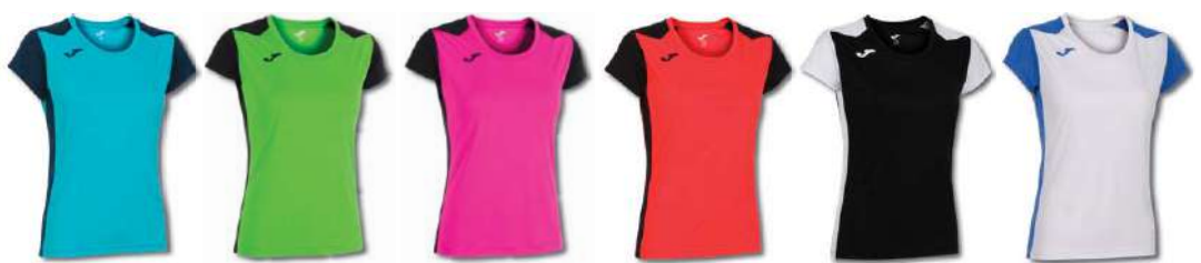
013 TURQIOSE FLUOR/ DARK NAVY 021 GREEN FLUOR/ BLACK 031 PINK FLUOR/ BLACK 041 CORAL FLUOR/ BLACK 102 BLACK/ WHITE 207 WHITE/ ROYAL