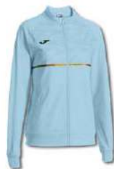
350 SKY BLUE