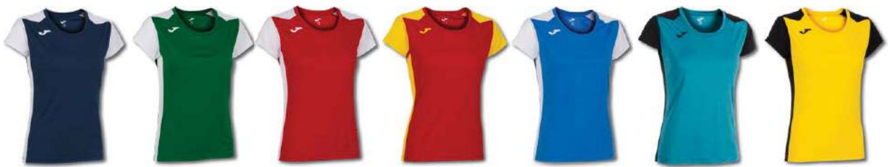
332 DARK NAVY/ WHITE 452 GREEN MEDIUM/ WHITE 602 RED/ WHITE 609 RED/ YELLOW 702 ROYAL/ WHITE 725 BLUEBIRD/ BLACK 901 YELLOW/ BLACK