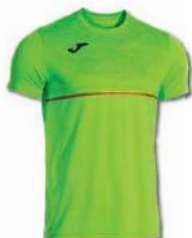
020 GREEN FLUOR

Light and stretchy fabric with Micro-Mesh System technology to wick sweat away. Comfortable seams. Sublimated design.