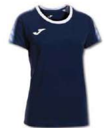
332 DARK NAVY/WHITE