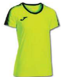
061 YELLOW FLUOR/ BLACK