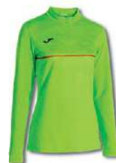
020 GREEN FLUOR