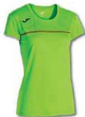
020 GREEN FLUOR

Light and stretchy fabric with Micro-Mesh System technology to wick sweat away. Comfortable seams. Sublimated design.