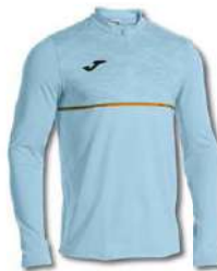
350 SKY BLUE