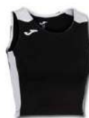
102 BLACK/ WHITE