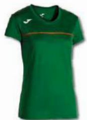
450 GREEN MEDIUM