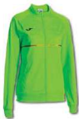
020 GREEN FLUOR

Comfortable and highly durable fabric. Ribbed fit on cuffs and hem. Raglan sleeves for greater comfort and freedom of movement. Front zip pockets.