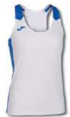
207 WHITE/ ROYAL