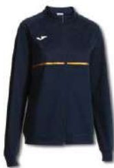
300 DARK NAVY