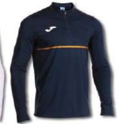
300 DARK NAVY