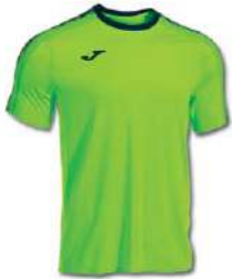
023 GREEN FLUOR/ DARK NAVY