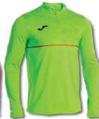
020 GREEN FLUOR