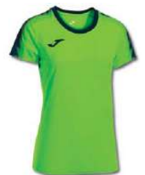
023 GREEN FLUOR/ DARK NAVY