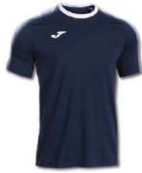
332 DARK NAVY/WHITE