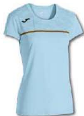
350 SKY BLUE