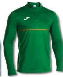
450 GREEN MEDIUM