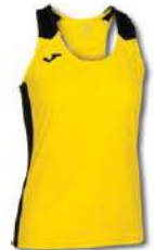
901 YELLOW/ BLACK