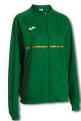
450 GREEN MEDIUM