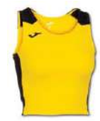
901 YELLOW/ BLACK