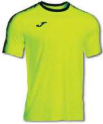
061 YELLOW FLUOR/ BLACK

Elastic antibacterial fabric, developed for high performance. Laser-cut finishes to prevent chafing. Sublimated design on the sleeves.