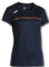
300 DARK NAVY