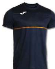
300 DARK NAVY